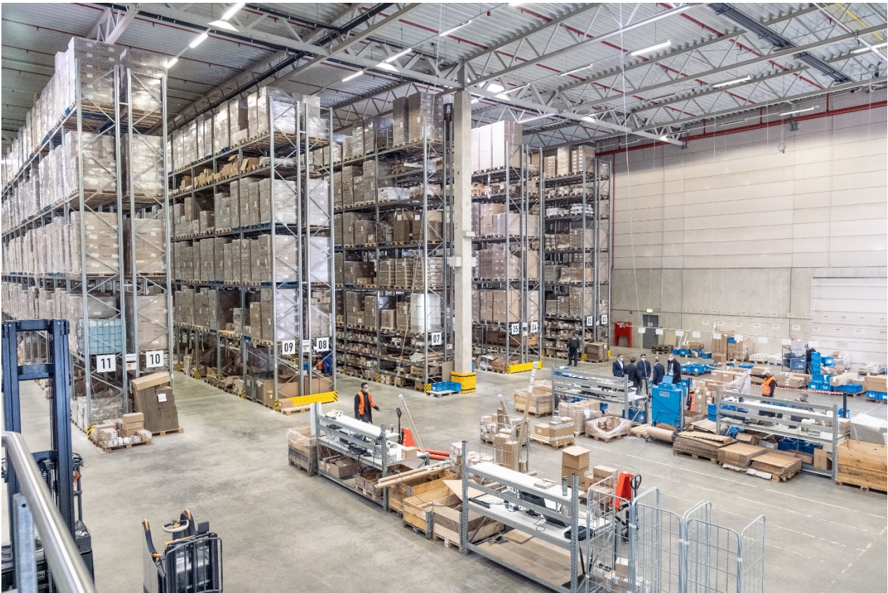
Afbeelding 4: HUECK heeft in het nieuwe magazijn de beschikking over in totaal 4.000 vierkante meter opslagruimte met mogelijkheid tot uitbreiding