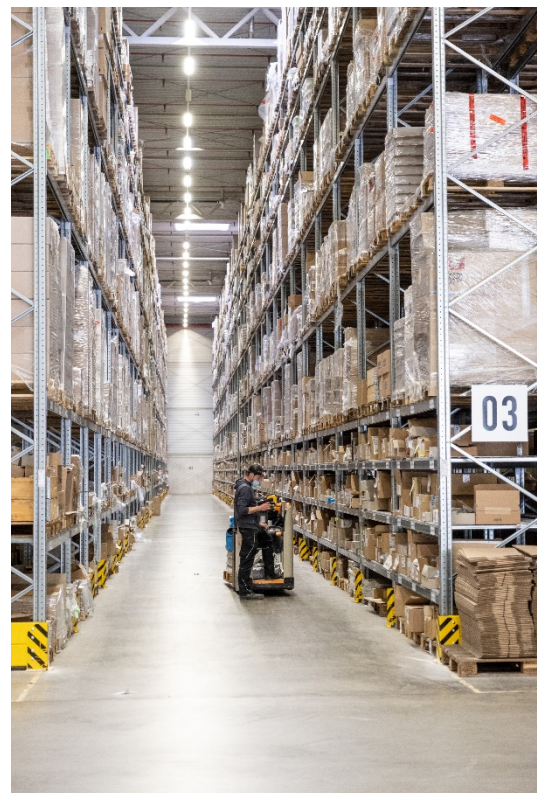
Afbeelding 6: In het nieuwe accessoiremagazijn heeft HUECK de beschikking over 3.800 palletopslagplaatsen en 1.800 schapruimtes.