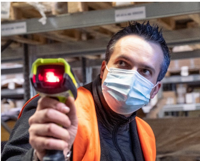
Afbeelding 5: De partners werken samen om de eco-balans van het hele logistieke proces voortdurend te verbeteren.