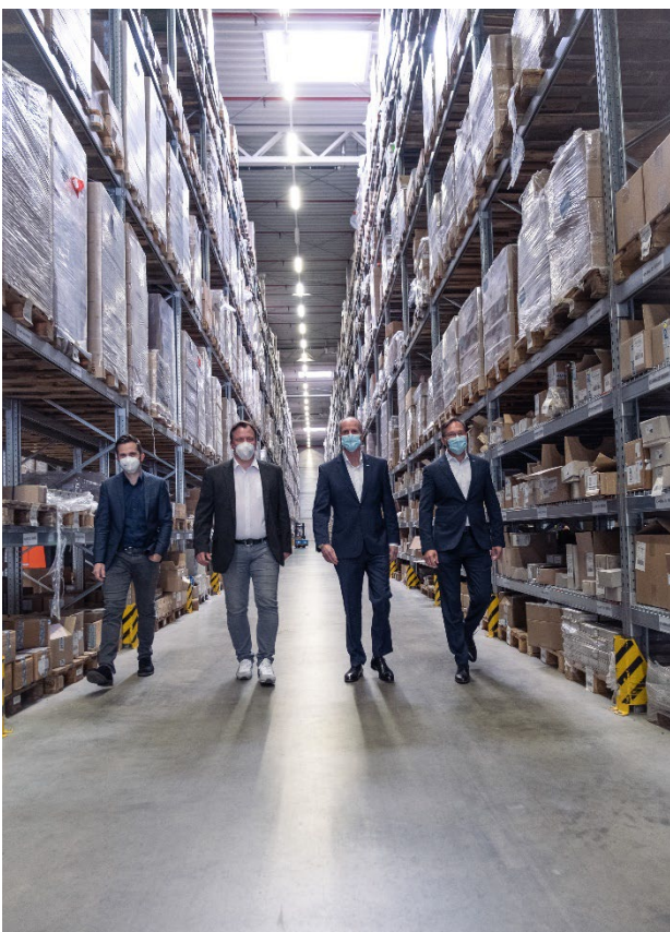
Afbeelding 2: Met de investering in het accessoiremagazijn zet HUECK verdere stappen naar een hogere klanttevredenheid.